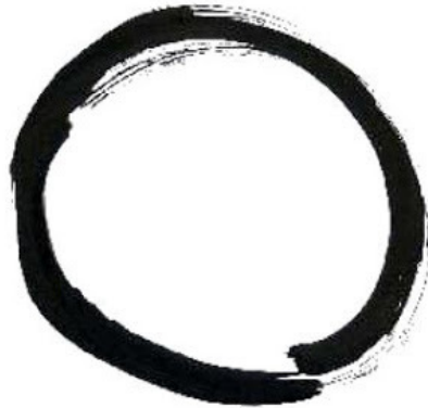
איור קלאסי של וו-ג'י

בציור שלפניכם, הוו-ג'י הוא החלק הריק שבתוך מסגרת העיגול ומסמל את הריקות האין סופית.